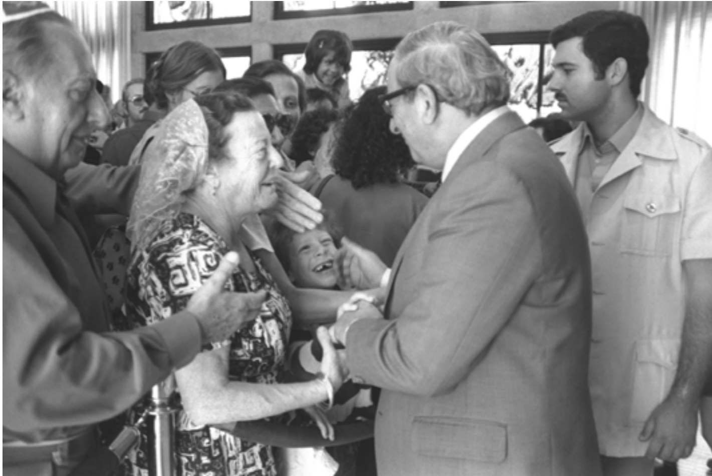
El presidente Yitzjak Navon saluda a los visitantes de la jornada de puertas abiertas en la residencia presidencial en Jerusalén, 1979

El centro Yitzjak Navon se establecerá en el corazón de un rincón de la naturaleza - la reserva natural "Neot Kdumim - parque Yitzjak Navon" situada a medio camino entre Jerusalén y Tel Aviv. Será un museo con una reserva natural que comprenderá unas 100 cabañas (sukot) naturales para estudios que ocupan el terreno de unos 2500 dunam en la zona boscosa de Ben shemen, en los cuáles han sido plantadas semillas de la antigua tierra de Israel y donde se han escavado y reconstruido herramientas agrícolas antiguas.